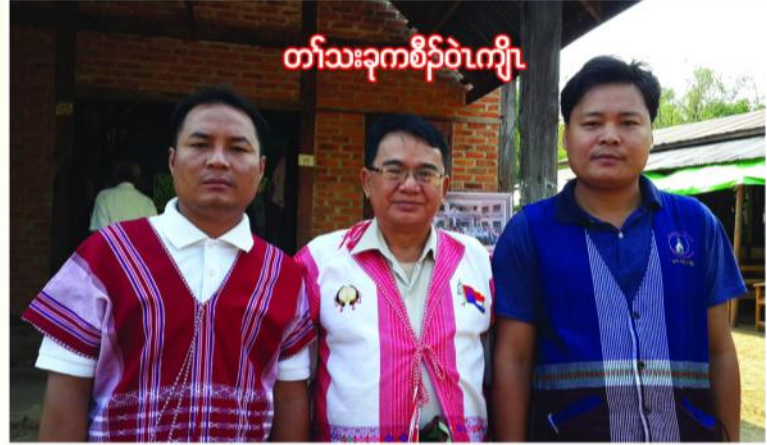
တော်သးခုကစီဝဲကျီ