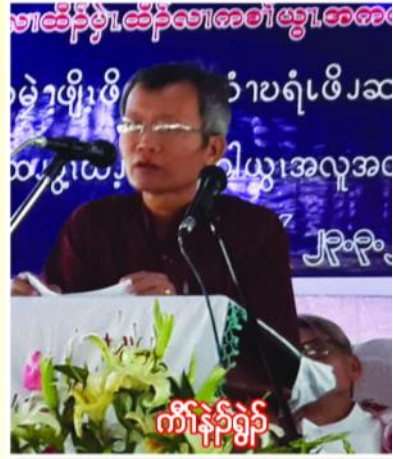
ကိုနီနီရှင်