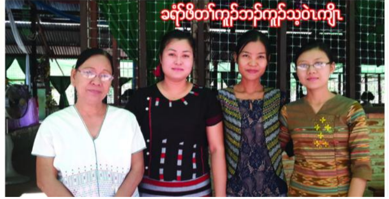
ခရိုင်တော်ကူဘက်ကူသ့ဝဲကျီ