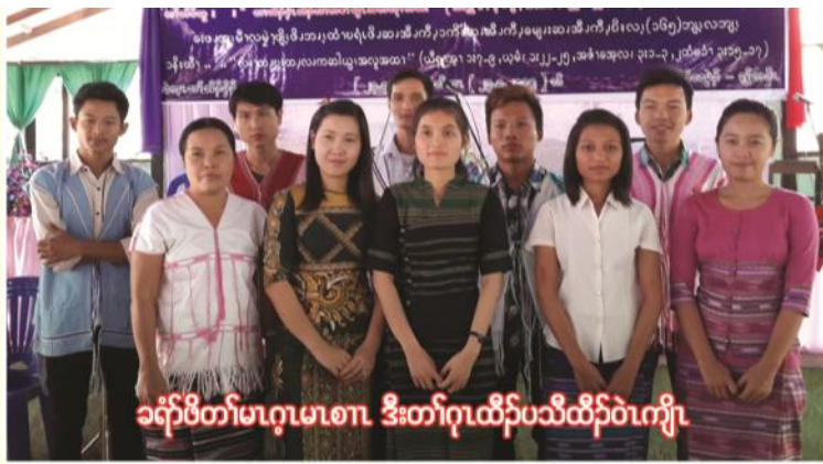
ခရိုင်မိတ်မာဂုမာစာ ဒီးတၢ်ဂုထီၣ်ပသီထီၣ်ဝဲကျိၤ