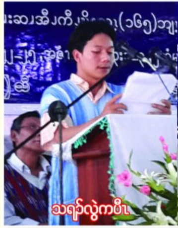
သရပ်လွဲကဝီ

ကိုဗစ်အုပ်စုပိုင်ပု အိတ်ဒီးကဝီ(၁၀)ကဝီလီ အမုတ် ဖပ်အုပ်ကဝီ၊ လူပျိုကဝီ၊ ကတတံးကဝီ၊ ဒုသတူကဝီ၊ ဒုယီကဝီ၊ ရမတံကဝီ၊ ကီးတရဲးကဝီ၊ မိတ်လမဲ့ရှင်ကဝီ၊ တီရီ ကဝီ၊ ဒီးကူးအုကဝီတဖပ်လီ။ ကိုအံ အိတ်ဒီးတော်အိတ်ဖိုင်(၈၄)ဖိုင်၊ တော်အိတ်ဖိုင်(၁၀၅၆၃)ဂ၊ တော်အိတ်ဖိုင်သရပ် (၈၇)ဂ ဒီးတော်အိတ် ဖိုင် သရပ်မုတ်(၁၃)ဂ၊ တော်အိတ်ဖိုင်သရပ်ဟ်စု(၄၉)ဂ၊ တော်မာဖိ ဟ်စု(၈)ဂနီလီ။ ကိုတော်မလီအိတ်ဝဲ(၃၀)ခါနီလီ။ လာ (၂၀၁၄ - ၂၀၁၆) တော် မအဝီအကို ပုဘက်မူဘက်ဒါတဖပ်မှိုင် သရပ်အံ့မုတ် (နီနီရှင်)၊ သရပ်လီမုတ်(နီနီရှင်သယံ)၊ သရပ်ထူထူယံ(ဝဲဒါးခိတ်)၊ သးပုစဲမယာတ်(ပုဟာစု)၊ သးပုဝဲထာတ်(ပုဖိုင်စုဒီးစရီ) နီလီ။ ကရကရီခိတ်နီတဖပ် မှိုင်သရပ်မုတ်ပံနီ (ဟီမုတ်ကရ)၊ သရပ် စဲမယာတ်စီ (ကျဲးစားကရ)၊ သရပ်မုတ်ဖိဒီနီ(ခရိုင်တော်ကူဘက် ကူသ့ဝဲကျီ)၊ သရပ်ကွဲးတုတ်(တော်သးခုကစီဒီး မဲး ရှာတ်ကျီ)၊ သရပ်ခိတ်ကအဲ(သရပ်သမိကရ) ဒီးသရပ်အံ့ဒါညူး (ခရိုင်တော် မာဂုမာစာဒီး တော်ဂုထိုင်ပုထိုင်ဝဲကျီ)တဖပ်လီ။