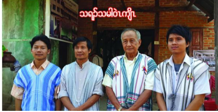
သရပ်သမိဝဲကျီ