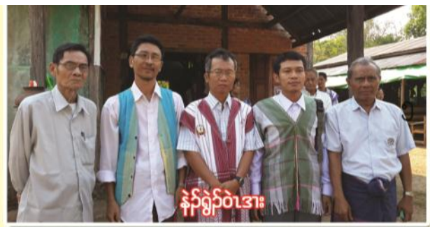
နီၣ်ခွဲၣ်ဝဲဒား