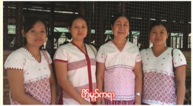
မိၣ်မုၢ်ကရၢ

ကီၢ်ဖဉ်အၣ်ပိၣ်လမ့ၣ်ပုၤကညီဘၣ်ထံခရိုင်မိ လံာ်စီဆံ့ကိၣ်ခိၣ် မ့ၢ်ဝဲ သရၣ်မုၢ်ဒီးကထာၣ်လဘၢနီၣ် ဒီးပုၤမာတၢ်မိအိၣ်ဝဲ (၁၁)ဂၤ န့ၣ်လီၤ. ကိုအံၤ အိၣ်ဒီး L.Th, CTS ဒီးခွဲးလီၤသီတၢ်မာလိတဖၣ် န့ၣ်လီၤ. တနံၣ်အံၤ ပုၤဖျိထီၣ်ကိၣ်အိၣ်ဝဲ(၁၆)ဂၤန့ၣ်လီၤ.